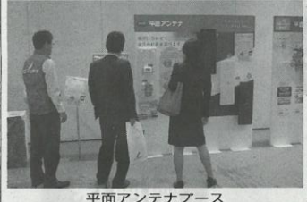
平面アンテナフース