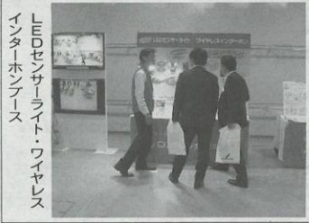
LEDセンサーライト・ワイヤレスインターホンフース