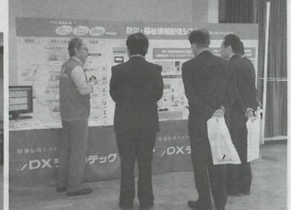
防災・福祉情報配信システム（仙台会場）

者の注目を集めた。またレベルチェッカーや各種アンテナ、フースターなどの新製品もフルラインアップで展示した。一方、新構築として、広島駅前で高層ビルの建設が進められており、受信アンテナの設置が好調に出ている。また阪神電鉄と山形県立病院の共同開発システムであるICタグを利用した児童の登下校メールサービス「登下校メールサービス」が好評で、速くから来たかといった言葉があった。講習会についても両会場とも盛況、今後の新しい仕事にと、参加者は熱心に聴講していた。