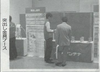
突出し金具フース