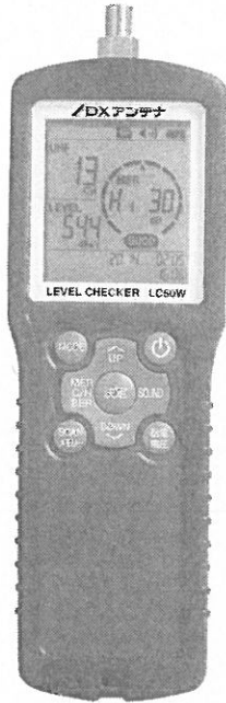
新型レベルチェッカー

ことから、新たなLAN配線工事が不要で導入コストの大幅削減が行える。一方高速同軸モデム「E OC10シリーズ」は、既設の同軸ケーブルを利用してIPネットワークを構築できる。既設のテレビ同軸ケーブル伝送路を利用する。一般住宅でのTVのインタ