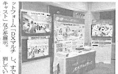
ハイビジョンみまもりシステム

BS・110度アンテナに電源供給できることから、電源がないところでも調整できることも大きな特長だ。また、各部屋のテレビ端子レベルの検査報告書が簡易な操作でプリントアウト「DXマルチキャスト」などを展示。なかでも注目を集めたのが、既設の同軸ケーブルでIPネットワークを構築できる「高速同軸モデム(E 50 W)」だ。