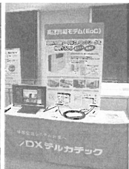
高速同軸モデム (E 50 W)