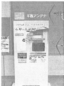
小型平面アンテナ