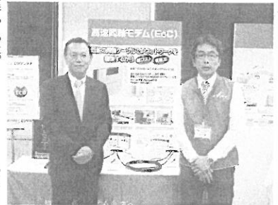
米山社長と立川群馬出張所所長

「E 50 W」をはじめとしたD Xデルカテックから、お客様の声でできた「アンテナ・テレビ受信機の新商品を披露した。 小型平面アンテナ「U A H 500」は、高さが316mmで、同社の従来タイプと比べて、約2分の1とい 「E 50 W」は、レベルと電圧が同時に測定でき、信号品質が同時に確認できる。一つの画面で確認できる。DC技術を用いて放送と通信を融合した情報配信システム「5月の電設工業展で発表