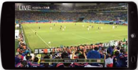
大画面で視聴できる

※3: 一般社団法人マルチスクリーン放送協議会が視聴アプリ「モアテレビ」を無料で提供しています。